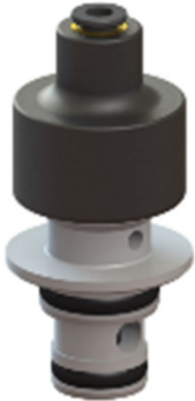
Typ 1710 pneumatisch